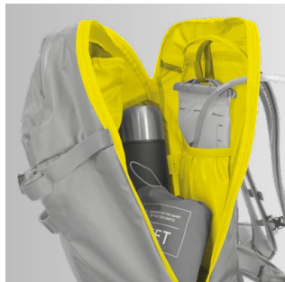
3 SISTEMA DI STOCCAGGIO MULTIFUNZIONALE

Accesso immediato all'equipaggiamento di sicurezza, all'attrezzatura ed agli accessori, grazie all'apertura ampia e alle tasche e scomparti funzionali studiati per mantenere ordinata e a portata di mano ogni cosa.