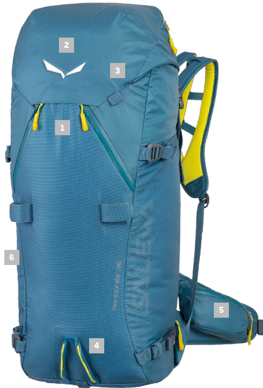
4 SUPPORTO PER PICCOZZA CON TASCA PROTETTIVA

Accesso immediato all'equipaggiamento di sicurezza, all'attrezzatura ed agli accessori, grazie all'apertura ampia e alle tasche e scomparti funzionali studiati per mantenere ordinata e a portata di mano ogni cosa.