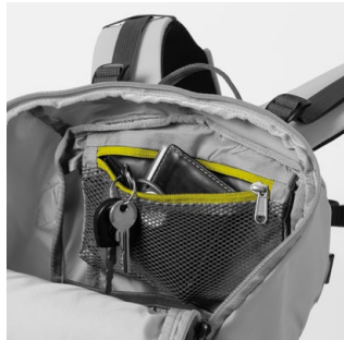
2 TASCA INTERNA PORTA VALORI