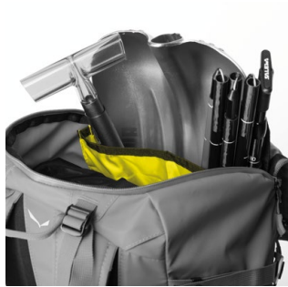
1 COMPARTIMENTO PER PALA E SONDA